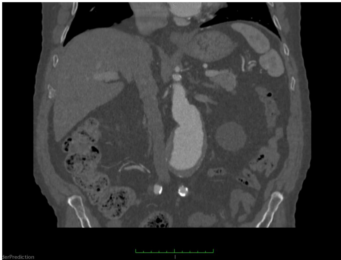
Fot. Przykładowe zdjęcia tętniaków aorty brzusznej podnerkowej i aorty piersiowej